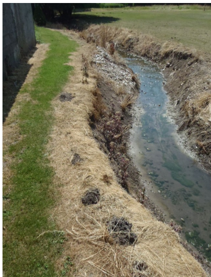
Cas de non-respect de la ZNT